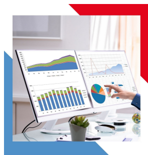
ARBEIDSMARKTANALYSE 2025 REGIO NOORDOOST-BRABANT