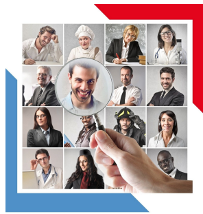
MEERJARENAGENDA 2026 - 2030 REGIO NOORDOOST-BRABANT